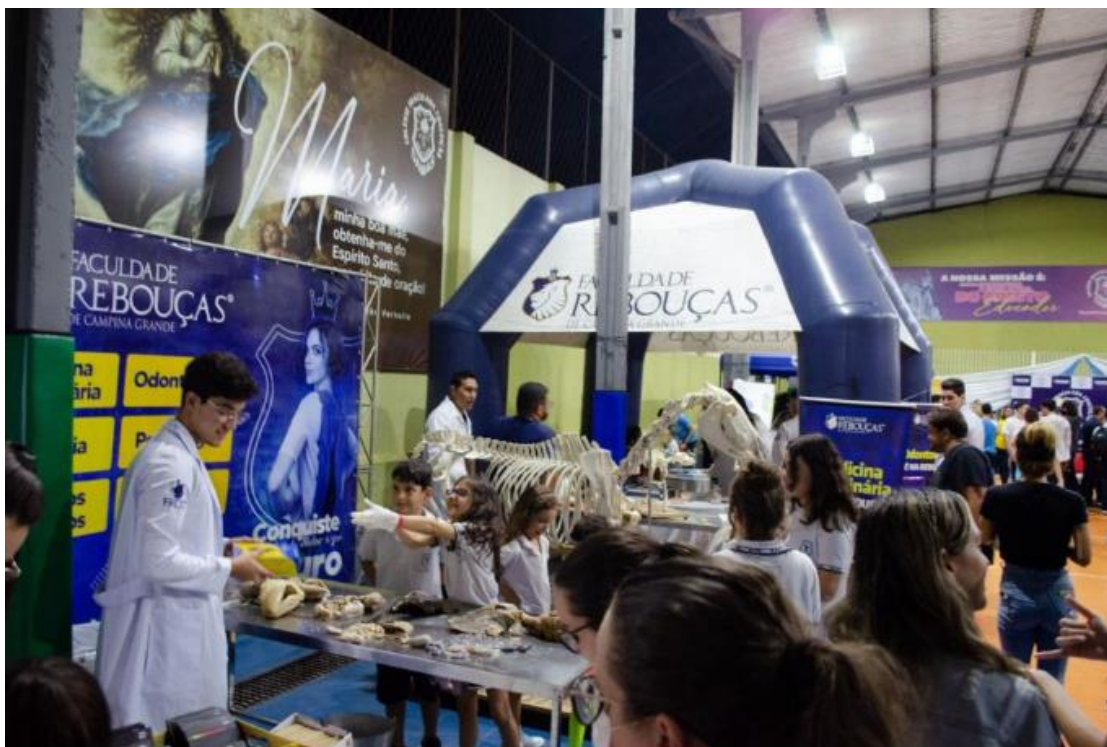
Mostra Campus 2022 Colégio Premem

https://www.faculdadereboucas.com.br/blog/post/1226